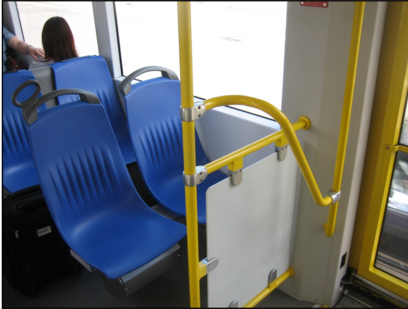
Bild 11 Gut sichtbare Haltegriffe in Straßenbahn

Das Foto 11 zeigt das Innere einer Straßenbahn bei der die Haltegriffe und -stangen grell gelb ausgeführt sind. Damit heben sie sich farblich sehr deutlich von den hellgrauen Wänden, dem dunklen Bodenbelag und den blauen Sitzen ab. Gleiches gilt für die gelbe Außentür.