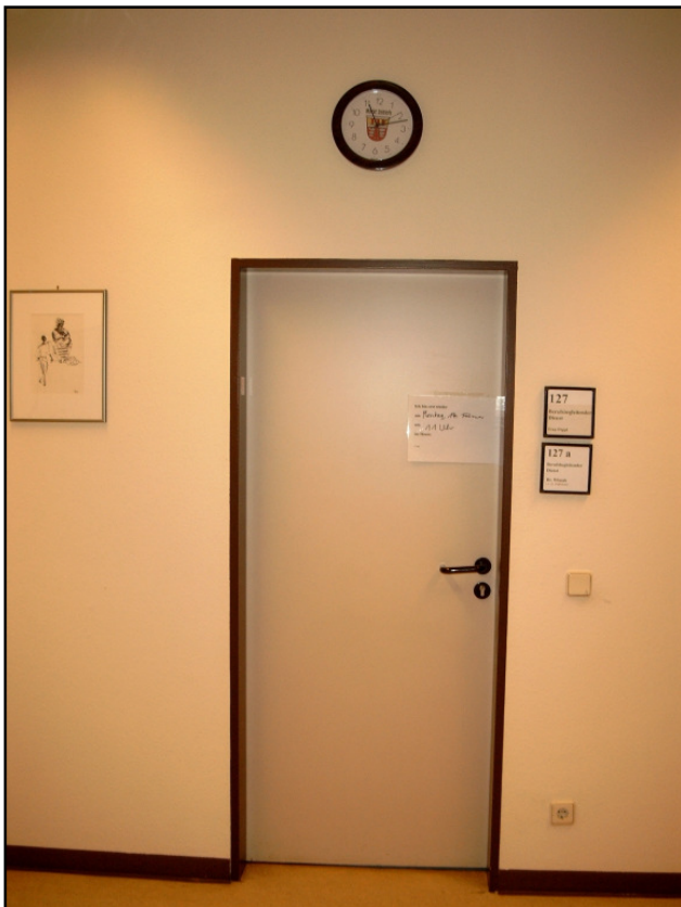
Bild 3 Gut erkennbare Tür

Die Bild 2 zeigt ein weißes Waschbecken mit darüber angeordneter kleinen Konsole. Der Abfluss im Waschbecken, der Wasserhahn und die Konsole sind rot und können somit von Sehbehinderten und Kurzsichtigen, die ohne Brille ins Bad kommen, gut erkannt werden. Rechts oberhalb des Waschbeckens in Höhe der Konsole ist eine Steckdose angeordnet. Auch diese ist rot und hebt sich dadurch gut von den weißen Wandfliesen ab.