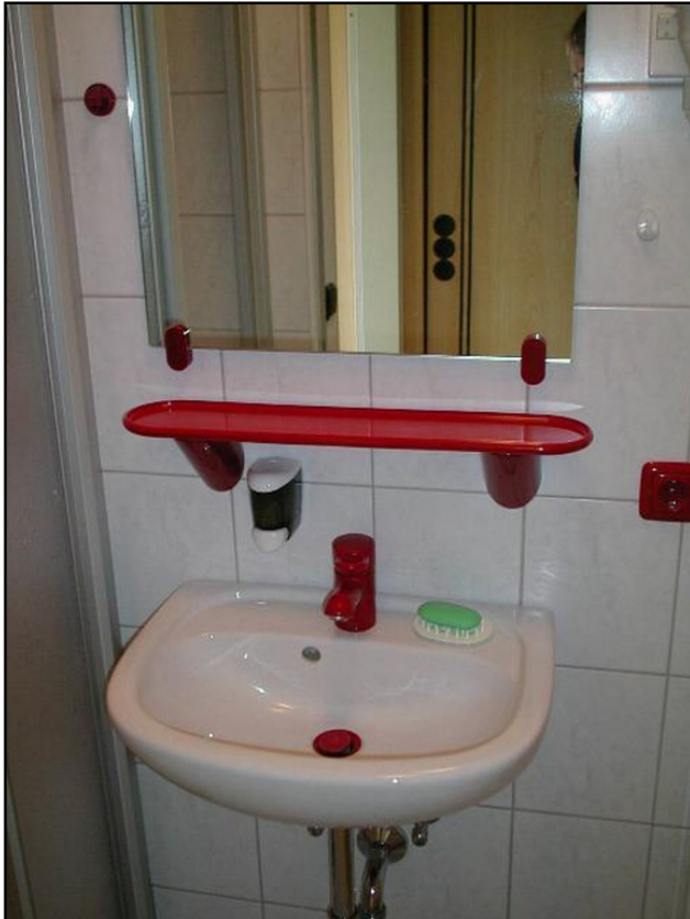
Bild 2 Kontrastreichgestaltetes Waschbecken

Die Bild 2 zeigt ein weißes Waschbecken mit darüber angeordneter kleinen Konsole. Der Abfluss im Waschbecken, der Wasserhahn und die Konsole sind rot und können somit von Sehbehinderten und Kurzsichtigen, die ohne Brille ins Bad kommen, gut erkannt werden. Rechts oberhalb des Waschbeckens in Höhe der Konsole ist eine Steckdose angeordnet. Auch diese ist rot und hebt sich dadurch gut von den weißen Wandfliesen ab.