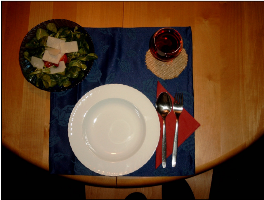
Bild 4 Gut erkennbares Gedeck

Bild 4 zeigt einen von oben in der Draufsicht fotografierten hellen Holztisch, auf dem ein dunkelblaues rechteckiges Set liegt. Auf dem Set steht ein weißer Teller, daneben ein Besteck auf einer hellroten Serviette. Links oberhalb des Tellers auf 11 Uhr Position befindet sich ein Salatteller. Gegenüber – auf circa 1 Uhr steht ein Glas Rotwein auf einem hellen Untersetzer.