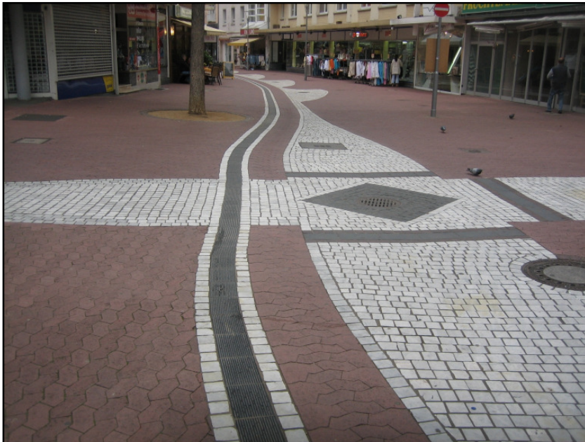
Bild 12 In Pflastermuster eingebundenes Boden-Leitsystem

Das Foto 11 zeigt das Innere einer Straßenbahn bei der die Haltegriffe und -stangen grell gelb ausgeführt sind. Damit heben sie sich farblich sehr deutlich von den hellgrauen Wänden, dem dunklen Bodenbelag und den blauen Sitzen ab. Gleiches gilt für die gelbe Außentür.