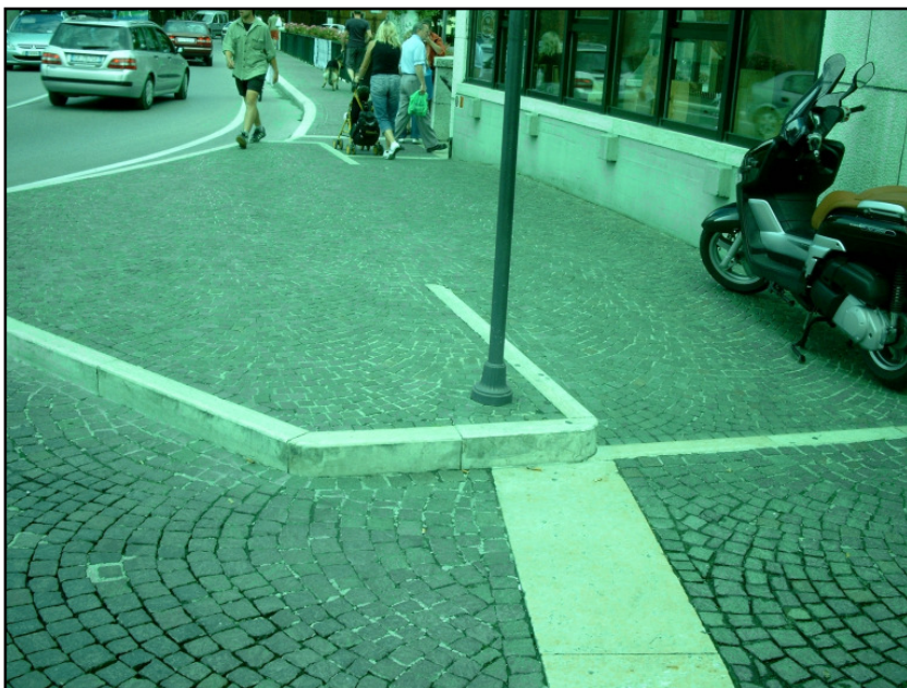
Bild 8 Kontrastreiche Bürgersteig

Die Fotografie 8 zeigt eine Straße mit Bürgersteig. Beide sind mit schwarzem Kopfsteinpflaster belegt. Der Bordstein besteht aus weißem Material, wodurch er auch bei schlechten Lichtverhältnissen erkennbar ist.