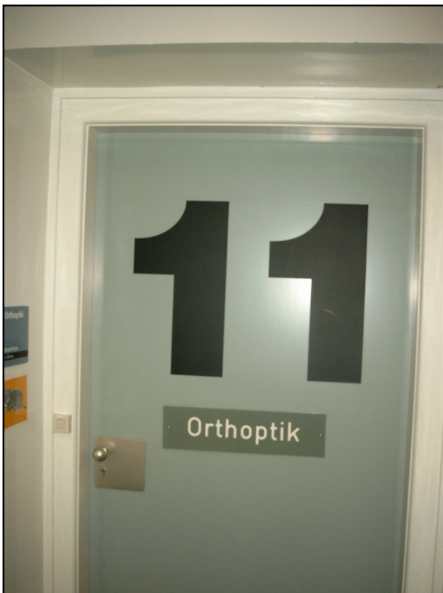
Bild 14 Kennzeichnung von Türen

Das Foto 13 zeigt einen Blick in den Frühstücksbereich eines Hotels. Die Wege zwischen den Tischen sind durch einen hellen dreireihigen Fliesenbelag vorgegeben. Die übrigen Bereiche, wo Tische und Stühle platziert sind, sind mit dunkelblauem Teppich ausgelegt. Dadurch ergibt sich ein visueller sowie taktiler Kontrast.