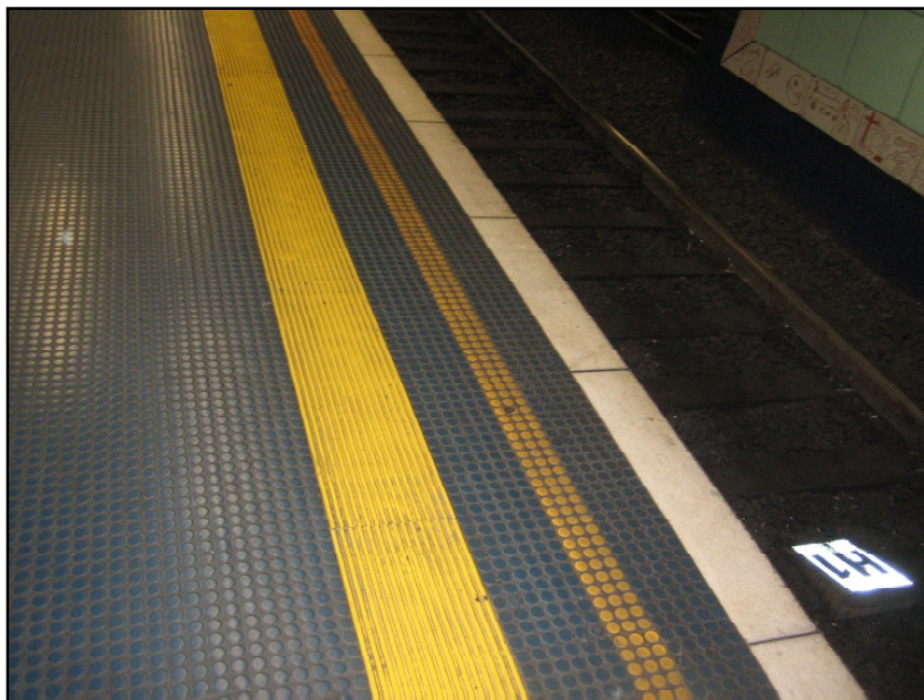
Bild 10 Kontrastreiche Bahnsteigkante

Das Foto 9 zeigt einen an einer mit weißen Fliesen gestalteten Wand in einer Höhe von ca. 1,10 m bis 1,70 m Höhe aufgehängten digitalen Fahrplan mit Angaben zu Zugabfahrtszeiten und Gleisen. Der Fahrplan (Display) ist mit einem dicken roten Rahmen umgeben, was das Auffinden erleichtert. Die angenehme Anbringhöhe ermöglicht auch sehbehinderten Menschen eine optimale Annäherung.