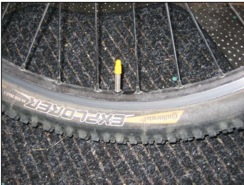
Bild 5 Kontrastreiches Fahrradventil

Bild 4 zeigt einen von oben in der Draufsicht fotografierten hellen Holztisch, auf dem ein dunkelblaues rechteckiges Set liegt. Auf dem Set steht ein weißer Teller, daneben ein Besteck auf einer hellroten Serviette. Links oberhalb des Tellers auf 11 Uhr Position befindet sich ein Salatteller. Gegenüber – auf circa 1 Uhr steht ein Glas Rotwein auf einem hellen Untersetzer.