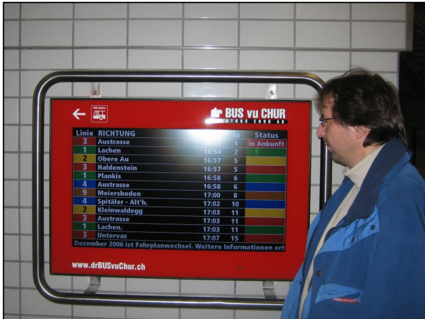
Bild 9 Fahrplan in Augenhöhe

Das Foto 9 zeigt einen an einer mit weißen Fliesen gestalteten Wand in einer Höhe von ca. 1,10 m bis 1,70 m Höhe aufgehängten digitalen Fahrplan mit Angaben zu Zugabfahrtszeiten und Gleisen. Der Fahrplan (Display) ist mit einem dicken roten Rahmen umgeben, was das Auffinden erleichtert. Die angenehme Anbringhöhe ermöglicht auch sehbehinderten Menschen eine optimale Annäherung.