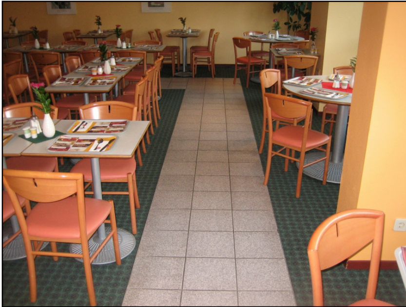
Bild 13 Deutlich sichtbare Wegeführung in Restaurant

Das Foto 13 zeigt einen Blick in den Frühstücksbereich eines Hotels. Die Wege zwischen den Tischen sind durch einen hellen dreireihigen Fliesenbelag vorgegeben. Die übrigen Bereiche, wo Tische und Stühle platziert sind, sind mit dunkelblauem Teppich ausgelegt. Dadurch ergibt sich ein visueller sowie taktiler Kontrast.